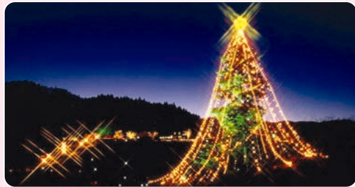
名物の高さ30m、1万個のイルミネーションが輝くクリスマスツリー

宮ヶ瀬湖は、宮ヶ瀬ダム建設によってできたビッグスケールのダム湖です。ダムができる以前からハイキングなどで人気があり、今や湖は、地域を盛り上げる観光名所の一部となっています。まず見ておきたいのは「ダムサイトエリア」。全国でも珍しい観光放流（実施曜日・時間はご確認ください。12月～3月は実施されません）が行われ、約100mの高低差が生み出す人口の滝は迫力満点。その他にも、一面のドウタンツツジや虹の大橋（全長330m）からの景観が楽しめる「鳥居原エリア」、カヌーや天体観測、グラススライダーなど自然と触れあう「宮ヶ瀬湖畔エリア」など、見どころ満載。さらにイベントも多数行われているので、年中楽しめます。