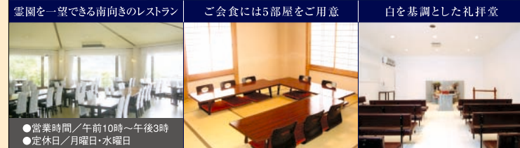
霊園を一望できる南向きのレストラン ご会食には5部屋をご用意 白を基調とした礼拝堂 皆さまご存じの礼拝堂や会食室などの充実した施設に加え、他の霊園にはないレストランも常時運営。お子さまからご年配の方まで、ゆっくりとお食事、ご休憩をしていただけます。