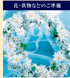
花・供物などのご準備 法要の際のご相談はお電話1本。当霊園では、お花や供物、引き出物の準備もいたします。