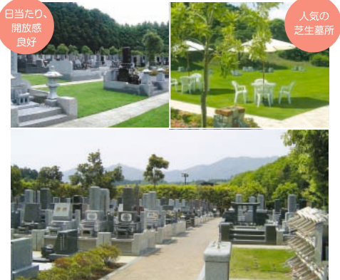
日当たり、開放感良好

さがみ野霊園では、様々なタイプの区画をご用意しております。お誘い合わせのうえお気軽に見学ください。