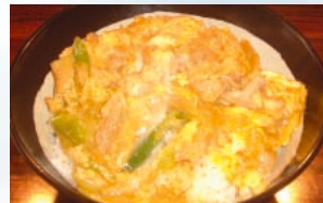
● 親子丼 600円

お子さまからご年配の方まで好評の「親子丼」。トロリとした卵と鶏肉との名コンビに箸が進みます。