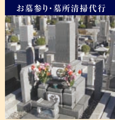
お墓参り・墓所清掃代行 当霊園ではお参り・清掃の代行も承っています。「忙しい」「体調がすぐれない」などでご来園が困難な場合はご相談ください。