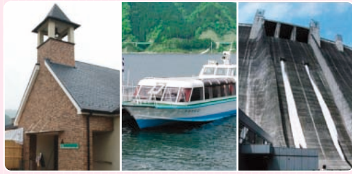
農産物・加工品販売の「鳥居原ふれあいの館」 宮ヶ瀬湖畔エリアで楽しめる「遊覧船」 ダムサイトエリアの見どころ「宮ヶ瀬ダム観光放流」

宮ヶ瀬湖は、宮ヶ瀬ダム建設によってできたビッグスケールのダム湖です。ダムができる以前からハイキングなどで人気があり、今や湖は、地域を盛り上げる観光名所の一部となっています。まず見ておきたいのは「ダムサイトエリア」。全国でも珍しい観光放流（実施曜日・時間はご確認ください。12月～3月は実施されません）が行われ、約100mの高低差が生み出す人口の滝は迫力満点。その他にも、一面のドウタンツツジや虹の大橋（全長330m）からの景観が楽しめる「鳥居原エリア」、カヌーや天体観測、グラススライダーなど自然と触れあう「宮ヶ瀬湖畔エリア」など、見どころ満載。さらにイベントも多数行われているので、年中楽しめます。