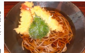
● 天ぷらそば 600円

お子さまからご年配の方まで好評の「親子丼」。トロリとした卵と鶏肉との名コンビに箸が進みます。